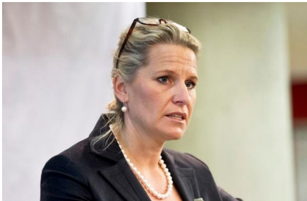
Präsidentin Martina Bandte

Bildunterschrift: Perspektivlosigkeit im Dauer-Lockdown: Noch stärker als die Umsätze brechen die Erträge ein. Die aufgestaute Saisonware führt zur Erosion der Preise. „Die Planbarkeit ist heute gleich Null. Wachstum erreicht man nur durch wirtschaftliche Aktivität. Und die gibt es nur mit einem Exit aus dem Lockdown ausreichend“, mahnt Martina Bandte, Präsidentin von Gesamtmasche.